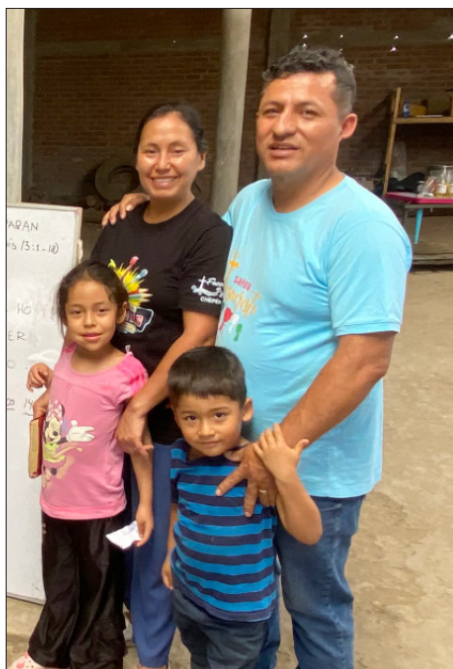
Ronal a Margia a'u teulu

yn y meysydd cenhadol, lle mae staff Cymdeithas Genhadol y Bedyddwyr (BMS) ar waith, ond mae'n siŵr fod adrannau cenhadol yr enwadau eraill yn cynnig tystiolaeth debyg.