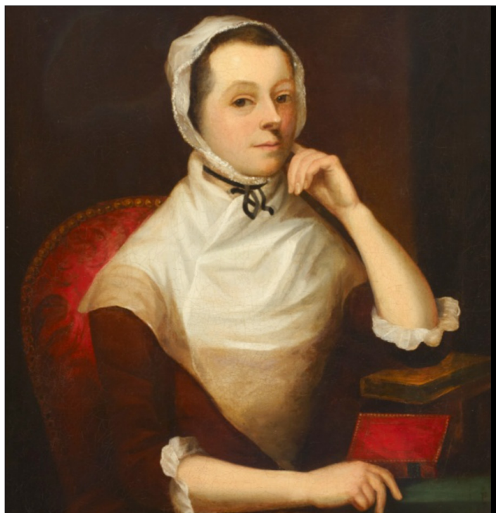
Portread o Ann Griffiths, gan artist anhysbys

Fe'i cawn hefyd yn rhyfeddu 'â mawr rhyfeddod' at waith achubol y Person rhyfeddol hwnnw. Dyna a agorodd y ffordd iddi hi, bechadur, ddod trwy ffydd i berthynas gariadus â'r Duw mawr, pur a sanctaidd. Ac nid hynny'n unig, ond gwelwn Ann yn hiraethu am gael treulio tragwyddoldeb