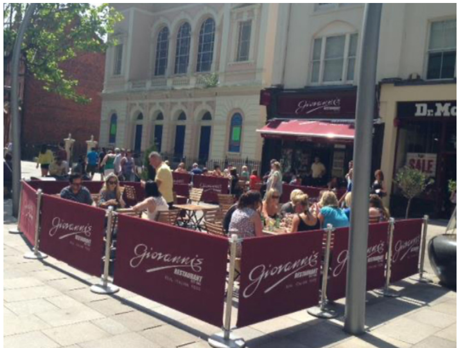
Bwyty Giovanni's gyda'r Tabernacl yn y cefndir

Yn fuan, daeth hi'n amlwg fod cyfle unigryw ac arbennig gan y Tabernacl i allu cynnig gwasanaeth fel hwn yng