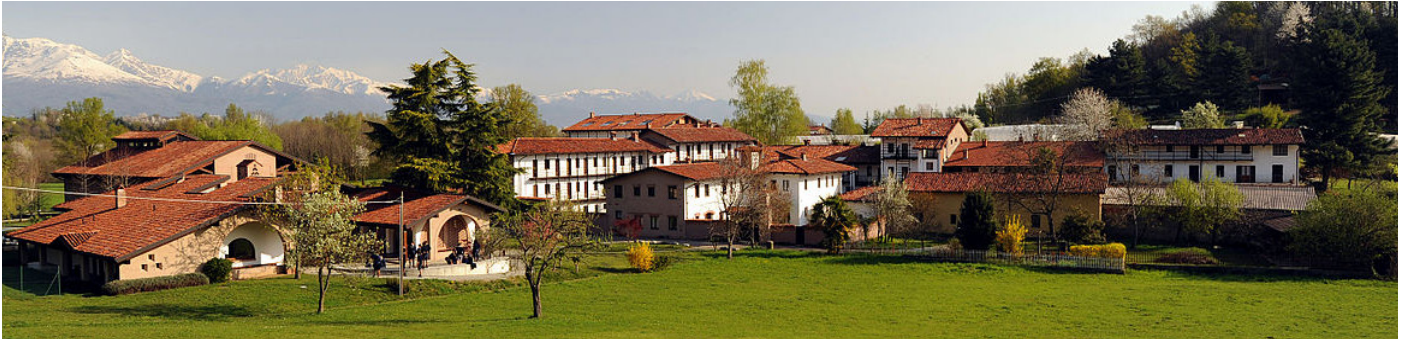
Cymuned fynachaidd Bose yng ngogledd yr Eidal (Wikipedia)