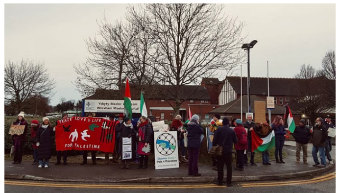
Ysbyty Maelor, Wrecsam