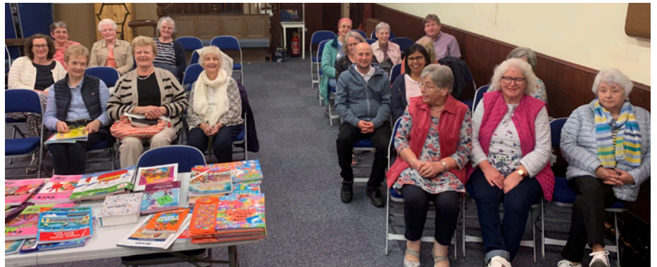
Noson i drafod gwaith plant yn ein heglwysi

Cafwyd trafodaeth fywiog, a bu'n braf clywed am y gwahanol weithgarwch sy'n