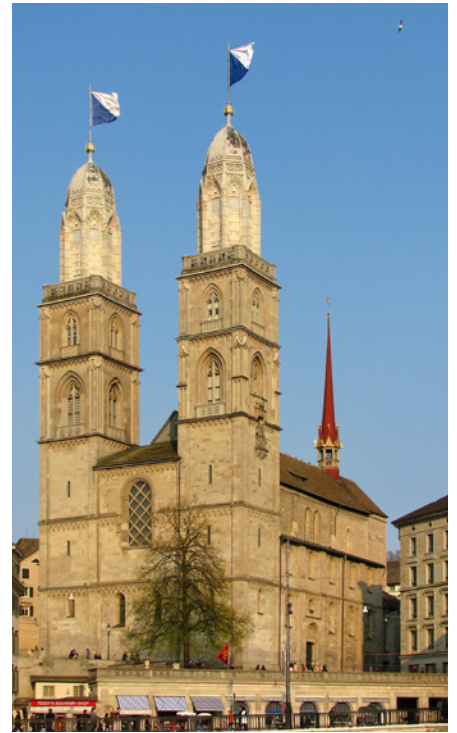
Grossmünster, Zurich

Ysgrifennodd Zwingli yn erbyn y syniad o offeiriadaeth ddibriod; yn wir, yn Ebrill 1524 cymerodd wraig ei hun. Erbyn y gwanwyn 1525 roedd yr offeren wedi'i dileu a sefydlwyd yn ei lle gymun syml yn canoli ar ddiolchgarwch i Grist a chof am ei aberth. Fel Wittenberg Almaenig