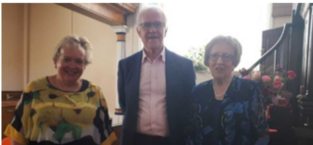
Arweinydd, Llywydd ac organyddes y Gymanfa Ganu