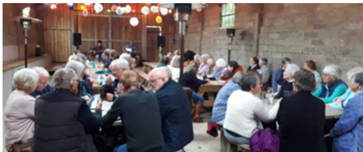
Mwynhau yn "Noson y Seren"