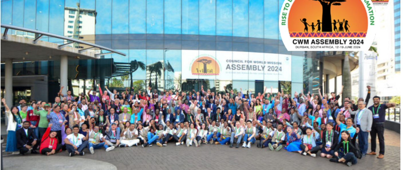
Cynhadledd CWM yn Durban

Roedd mynychu Cynulliad Cyngor y Genhadaeth Fyd-eang (CWM) yn Ne Affrica yn brofiad trawsnewidiol. Fel cynrychiolydd ieuencid ar ran Eglwys Bresbyteriaidd Cymru, ymunais â theulu CWM, sy'n cynnwys 32 o eglwysi ar draws y byd, ar daith ddofn o undod a chyfeillgarwch.