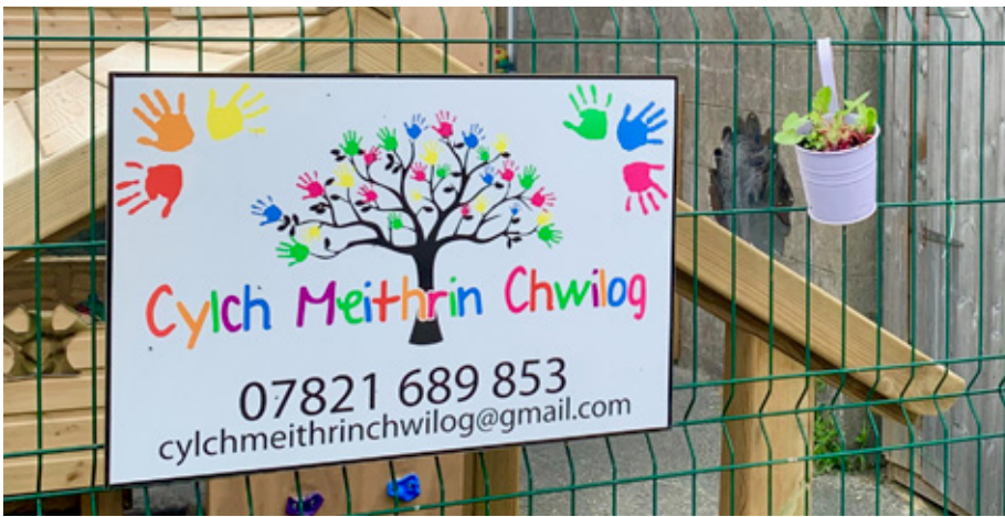
Cylch Meithrin Chwilog sydd bellach yn cartrefu yn festri Capel Uchaf Chwilog yn barhaol