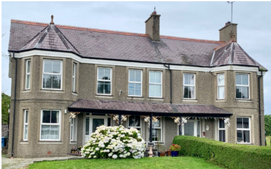
Yr hen fans a dau fflat sy'n gartref i dri theulu yn Chwilog

Erbyn hyn, mi fydd yr enwadau'n edrych yn ofalus iawn ar y sefyllfa'n lleol cyn penderfynu gwerthu unrhyw adeilad, gan ofyn a oes 'na gyfle cenhadol, neu a oes modd plannu rhywbeth newydd, neu weithio'n gydenwadol i sefydlu gwaith newydd. Ond mewn amryw o sefyllfaoedd, ni fydd yr adeiladau hynny'n addas ar gyfer gwaith newydd. Ac os yw cyflwr yr adeiladau'n sâl, mae'n well gwaredu a llogi/prynu gofod mwy addas. Mae sawl eglwys flaengar wedi gwerthu adeilad oedd yn anaddas ar