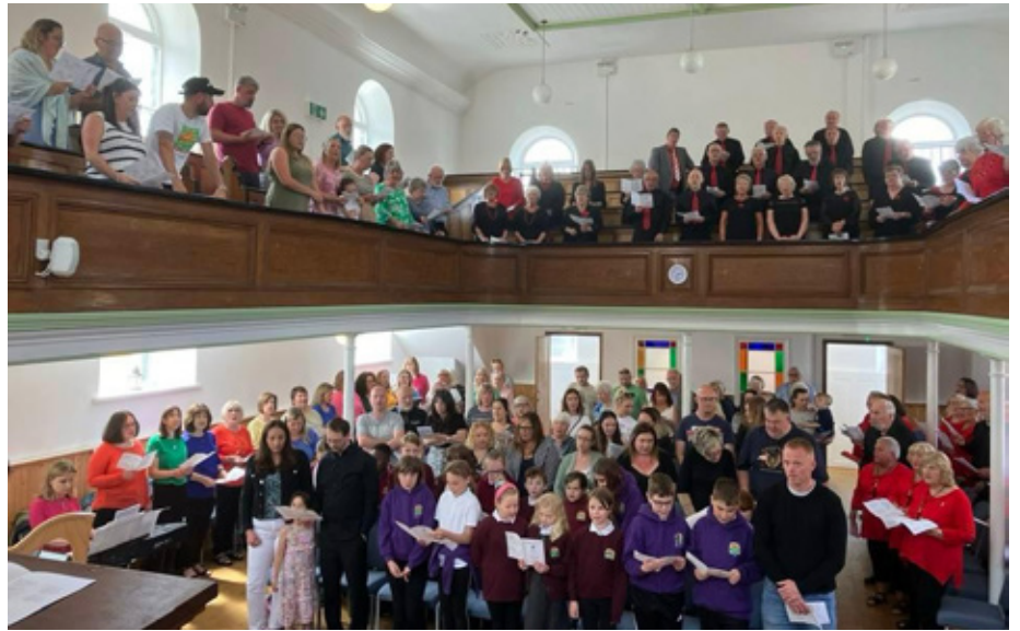
Cymanfa Ganu yn Seion, Waunarllwydd, un o gapeli'r Bedyddwyr

Fe waethygodd pethau, a daeth tro ar fyfyrwyr hyd yn oed ymhlith y Cymry Cymraeg. Gwagiodd ein capeli, dilëwyd dysgu solffa o gwricwlwm ysgol ac ysgol Sul, ac