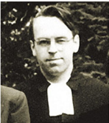
Moltmann yn weinidog ifanc yn Bremen

Flynnyddoedd yn ddiweddarach, ac wedi bod am dair blynedd yn weinidog yn Bremen ysgrifennodd, 'Ni chofiaf amser i mi ymrwymo i Grist ( a decision for Christ ) yw'r cyfieithiad Saesneg) ond fe wn i sicrwydd mai yn nhywyllwch fy enaid y gwelodd Crist fi.'