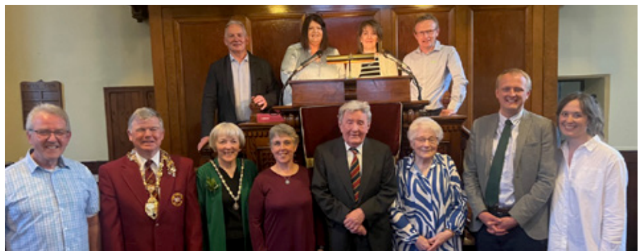
Y rhai a gymerodd ran yn y noson