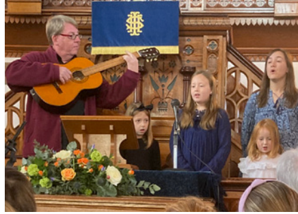
Y teulu MacDonald o Batagonia