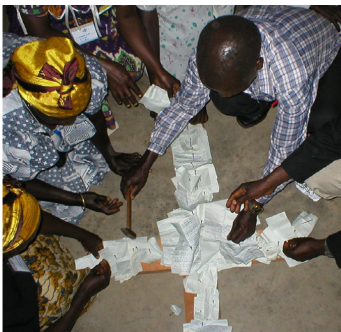
Hoelio'u storïau ar y Groes

Y tro cyntaf i mi fynd i Rwanda, ym mis Medi 1994, 12 wythnos ar ol i'r hil-laddiad yn erbyn y Tutsi ddod i ben, roedd yn lle tywyll iawn. Roedden nhw'n amcangyfrif fod hyd at filiwn o bobl wedi cael eu lladd mewn can niwrnod. Doedd yna ddim arwydd o obaith yn unrhyw le. Ac eto, yr adnod ddaeth i'm meddwl oedd Rhufeiniaid 15:13 sy'n sôn am Dduw'r gobaith yn gwneud i obaith