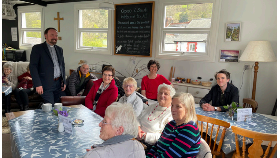
Mwynhau o gwmpas y byrddau a'r sofffa yn yr Hedyn Mwstard

Ond roedd hi'n dipyn o her. Byddai eisiau gwirfoddolwyr newydd, uwchraddio'r gegin a rhoi gwedd newydd i'r adeilad. Felly, dyma ni'n cynnal gwynos weddi a cheisio'r Arglwydd am noson a diwrnod cyfan. A daeth atebion i weddi! Rhoddodd Duw bobl i ni: digon o bobl i redeg y caffi ddau ddiwrnod yr wythnos - rhai i ffurfio pwyllgor, eraill â phrofiad o redeg caffi a'r sgiliau i wneud yr ailwampio. Cawsom grant sylweddol gan yr Eglwys yng Nghymru a rhoddion