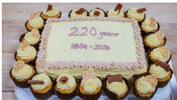
Cacen dathlu pen-blwydd Cymdeithas y Beibl yn 220 oed