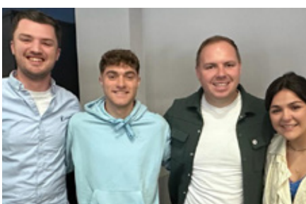
Rhai o'r gweithwyr fu'n cyfrannu

Dechreuwyd adroddiad y Gwasanaeth Plant ac Ieuenctid gyda fideo a gynhyrchwyd ddeng mlynedd yn ôl i annog yr eglwys i gofio am eu cyfrifoldeb 'i ddweud wrth y genhedlaeth nesaf... am ei nerth a'r pethau rhyfeddol a wnaeth' (Salm 78:4). Erbyn diwedd y cyflwyniad yr oedd yn hyfrydwch cael diweddariad gan rai o'r plant fu'n rhan o'r ffilm gyda'u gobaith ar gyfer y deng mlynedd nesaf.