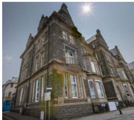
Y Coleg Diwinyddol, Aberystwyth