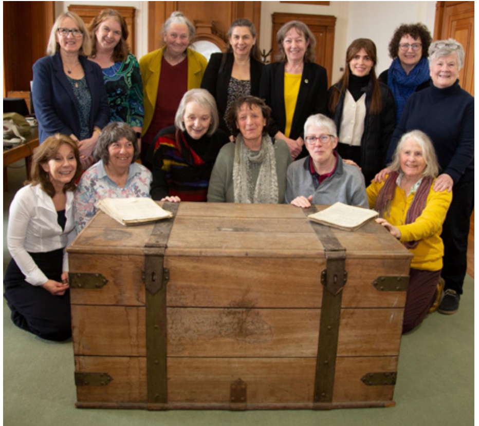
Aelodau o'r ymgyrch Heddwch Nain / Mam-gu yn croesawu'r gist i'w chartref newydd yn y Lyfrgell Genedlaethol