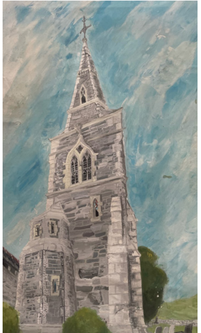
Darlun o dŵr eglwys Gwyddelwern