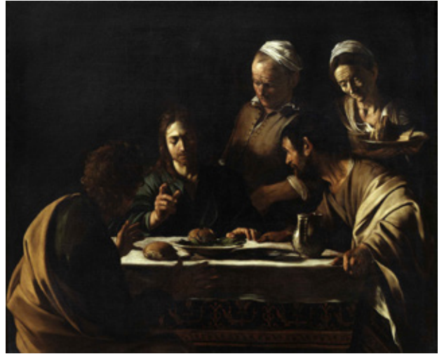
L lun: Caravaggio Emaus

Cyn i Iesu esgyn i'r nefoedd, dywedodd wrth ei ddilynwyr am 'fynd i wneud disgyblion o bob cenedl'.