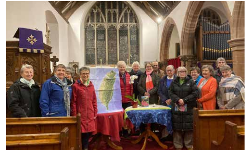
Capel y Dyffryn, Llandyrnog, gyda Chwirydd Eglwys Sant Tynog