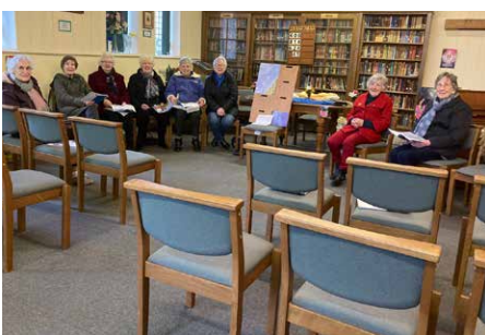
Chwirydd Mynydd Seion Abergele