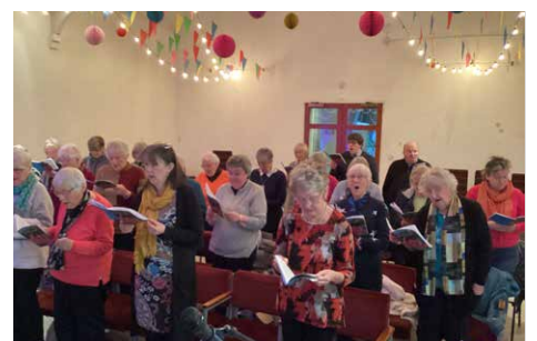
Coleg y Bala, gydag aelodau Gofalaeth Thomas Charles, Annibynwyr ac Eglwys Crist y Bala