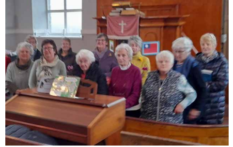
Capel Pen-cae, gydag Eglwys Annibynol Nanternis