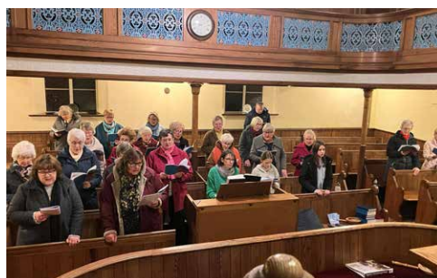
Capel Ffynnonbedr, Sir Gaerfyrddin