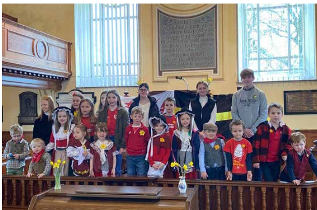
Aelodau Ysgol Sul Rhydfendigaid, Pontrhydfendigaid, yn eu gwasanaeth a chyngerdd Gŵyl Ddewi