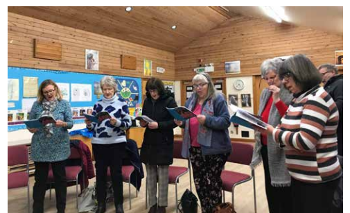
Capel y Groes ac Ebeneser, Wrecsam