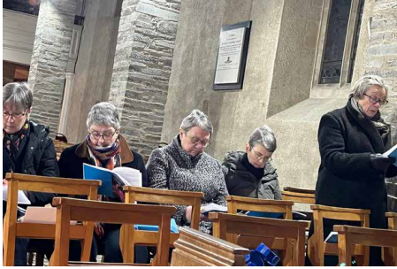
Eglwys Castellnewydd Emlyn