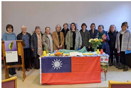
Capel Cynllwyd, Gofalaeth Bro Llanuwchllyn