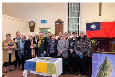
Capeli Dinbych gyda 'i gilydd yng Nghapel y Fron