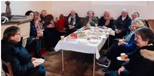
Capel Pen-llwyn ac Eglwys Dewi Sant, Capel Bangor