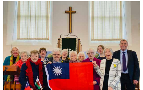
Capel y Garn a'r Noddfa, Bow Street