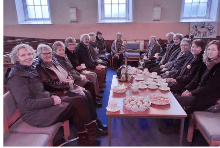
Capel Seion, Ceredigion