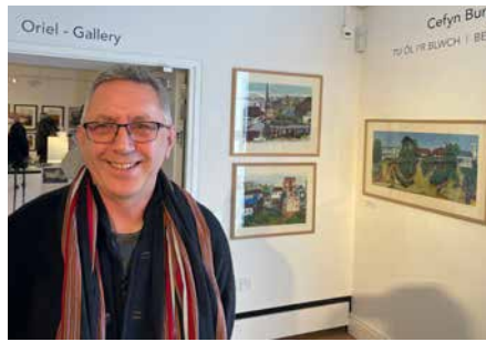
Cefyn ar agoriad yr arddangosfa yn Storiel, Bangor

Cafodd y dirwedd a bywyd ym mryniau Casia eu cofnodi a'u darlunio mewn dyfrliwiau a llythyrau gan y cenhadon Cymreig dros y blynyddoedd. Felly, mae'r darluniau a'r dogfennau hyn yn ganllawiau a chyflwyniad i'r amgylchedd, y bensaerniaeth a bywyd yn gyffredinol ym mryniau Gogledd-ddwyrain India.