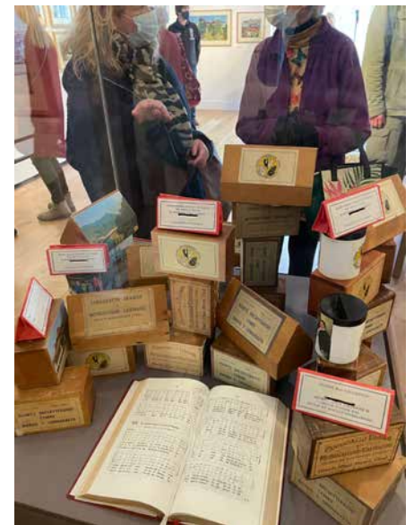
Blychau cenhadol wedi eu gosod fel dinas ar y bryniau yn rhan o'r arddangosfa