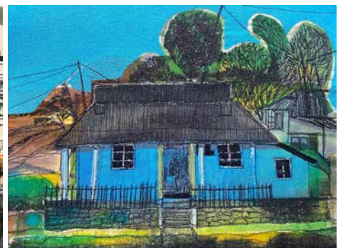
Bwthyn Glas yn Soha, Bryniau Casia