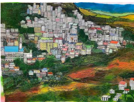
Golygfa o Aizawl ym Mizoram yn dangos tirlithriad diweddar