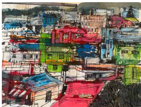
Golygfa o Shillong gyda llyfr emynau yn gefndir