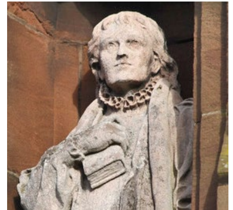
Cerflun o Edmwnd Prys ar gobeb cyfieithwyr y Beibl, Eglwys Gadeiriol Llanelwyr