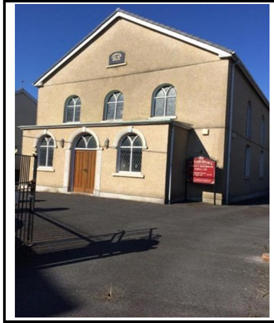
Capel Tabernacl Pontarddulais