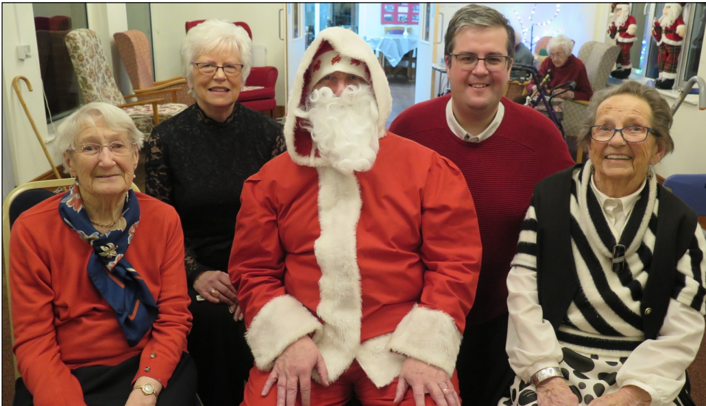
Uchod, Aelodau Bethania gyda Santa ac isod Triawd y Nadolig