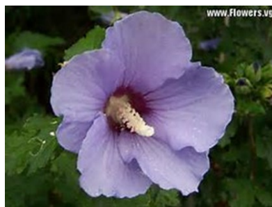
Rhosyn Saron

Saron – darn o dir da a ffrwythlon dros ben yw hwn sydd rhwng mynyddoedd canoldir Israel a'r môr. Rhosyn Saron meddai Ann Griffiths am Iesu. Math o Hibiscus yw'r blodyn ac mae yn un hardd iawn.