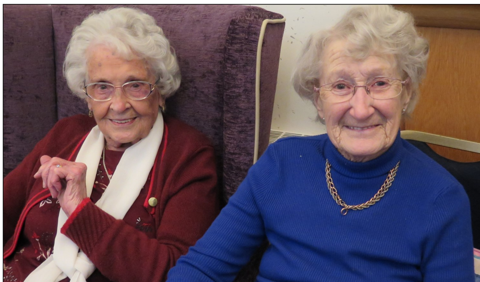
Y ddwy wraig hynaf yn y cartref yn mwynhau.