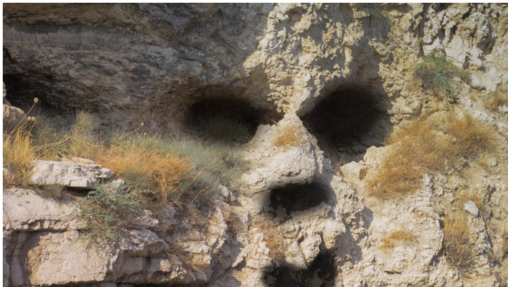
Bryn Calfaria

Calfaria – Gan Luc hefyd y cawn yr enw Calfaria, mae'r lleill yn defnyddio Golgotha'r Hebraeg (o'r Aramaeg Gulgata) sef Lle y Benglog. Enwyd y fan meddir ar ôl y bryn isel tu allan i furiau Jeriwsalem bryd hwnnw lle croeshoeliwyd Iesu. Y gair Groeg ddefnyddia Luc am y lle yw Kranion (cranium, asgwrn penglog). Os mai hwn yw'r bryn cywir a ddangosir i dwristiaid heddiw mae'r garreg galch wedi treulio i siap penglog gydag ogofau yn dyllau llygaid. Man dienyddio amlwg ydoedd ger y ffordd fawr, ac o bosib bod penglogau ac esgyrn cyrff na chladdwyd hwy wedi eu gadael o gwmpas y fan.