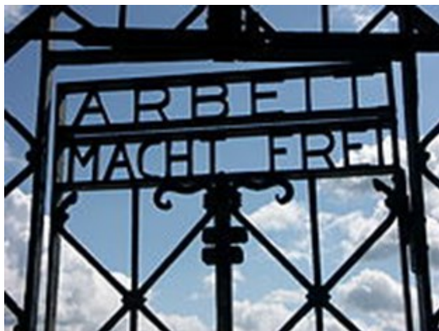
Bydd Gwaith yn Rhyddhau uwchben gât yn Auschwitz

Roedden' nhw'n cyrraedd mewn wagenni anifeiliad, rhwng pobl eraill ac yn sefyll yn dyn a chlos, heb fwyd na diod am dridiau. Bwced yn y gornel. Amgylchiadau anhygoel, afiach, anesmwyth a llaith.