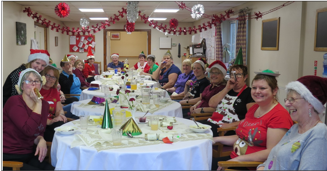
Staff y cartref yn mwynhau'r ginio Nadolig.