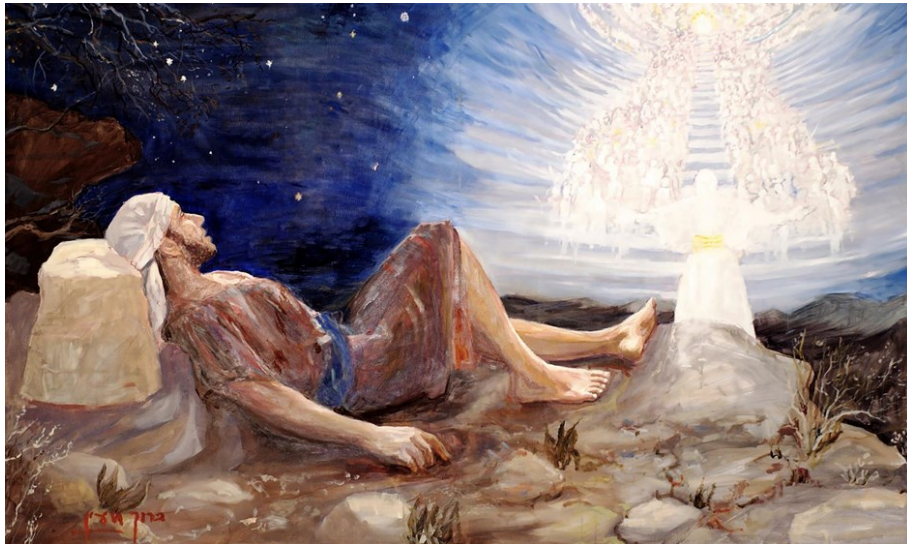
Jacob yn Bethel

Bethel – Tŷ i Dduw (a phorth y Nefoedd) meddai Jacob y twyllwr pan oedd yn ffoi am Mesopotamia rhag ei frawd, Esau. Yno, wedi penderfynu aros dros nos cafodd freuddwyd am angylion ac ystol i'r nefoedd tra'n cysgu a'i ben ar garreg. Hen enw'r lle oedd Luz meddai awdur Genesis. Yn y bore cysegrodd Jacob y garreg am ei fod wedi cyfarfod â Duw yno.