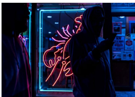
Holman Hunt Tudalen 3

Mae ein plant a'n pobl ifanc yn wynebu llif diddiwedd o ddeunydd ar y gwefannau hyn sy'n normaleiddio trais rhywiol a syniadau dynon sy'n casáu merched. Un rheswm dros y twf hwn yn y diwydiant pornograffiaeth yw'r ffaith nad yw'n cael ei reoli, nac yn atebol mewn unrhyw ffordd. Elw sy'n gyrru'r anghenfil hwn, ac o ganlyniad dosberthir deunydd o drais rhywiol anghyfreithlon ar raddfa sydd y tu hwnt i'n dychymyg, heb atebolrwydd i unrhyw lywodraeth ar draws y byd.